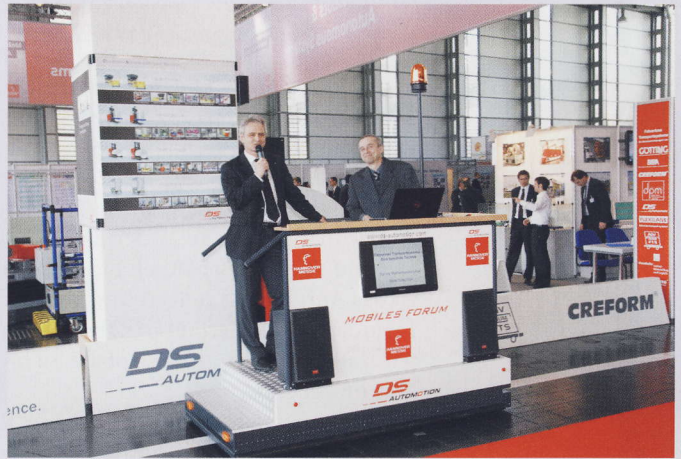
Bild 3 Ein freinavigierendes FTF bot die Bühne für das „Mobile Forum“ auf der Hannover Messe.