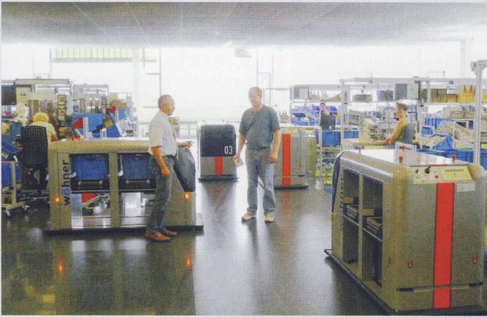
Bild 2 FTF-Verkehr in der Montage.

So gibt es bereits die ersten Projekte, in denen die FTS-Richtlinienwelt des VDI explizit vertraglich zugrunde gelegt wurde. Einige Themen sind dabei von besonderer Bedeutung, z. B. die Planungsschritte als Basis für das Projektmanagement, die FTS-relevanten Anforderungen an periphere Einrichtungen wie Aufzüge, Feuerschutztüren und Fußböden sowie die AbnahmeprozEDUREN und Leistungstests.